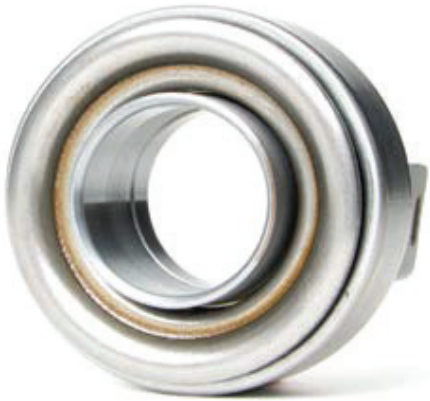
Resim 1: Metal burçlu debriyaj rulmanları yağlanmalıdır.

Araç üreticisinin teknik özelliklerine uyunuz!