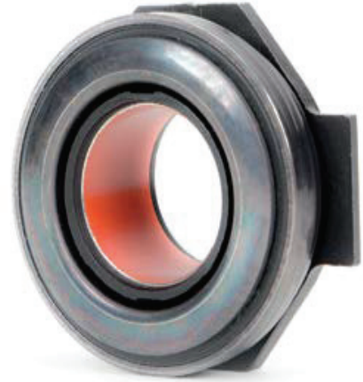
Resim 3: PTFE burçlu debriyaj rulmanları yağlanmamalıdır.