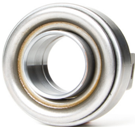
Fig. 1: Drukklagers met metalen bussen moeten van smeermiddel worden voorzien

Neem altijd de aanwijzingen van de autofabrikant in acht.