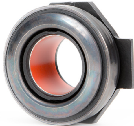
Fig. 3: Drukklagers met PTFE-bussen mogen niet van smeermiddel worden voorzien